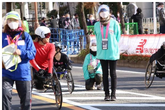
スタッフはマスク・フェイスシールドを着用