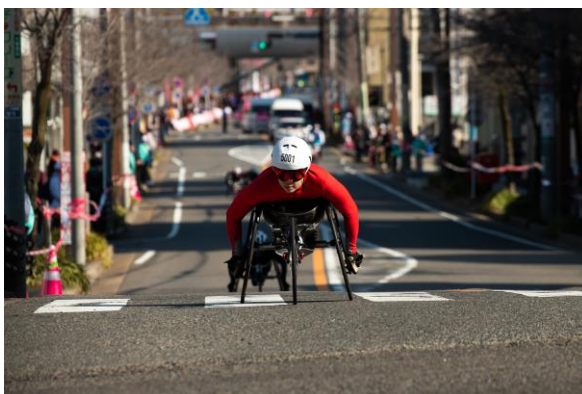
優勝した喜納選手