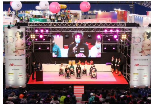
マラソン EXPO(ナゴヤドーム)内ステージでの表彰セレモニー