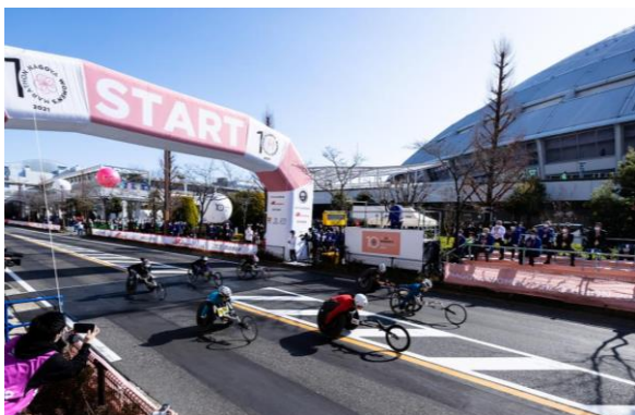
ナゴヤドーム前をスタート